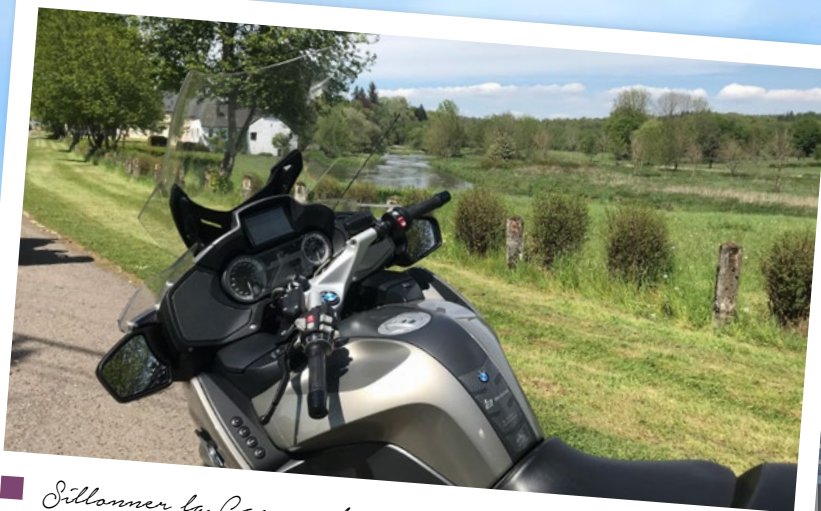
■ Sillonner la Gaume et ses nombreux villages typiques de la vallée de la Semois.

La beauté de l'étang de Virelles confirmera que vous êtes bien en direction des Lacs de l'Eau d'Heure. Le site est magnifique et invite, après les 210 premiers kilomètres, à la pause-déjeuner. Sur plus de 6 km 2 , cette étendue d'eau est une véritable invitation aux activités nautiques. Le reste de l'itinéraire du jour conduira à nouveau en terre française, pour rejoindre la destination finale