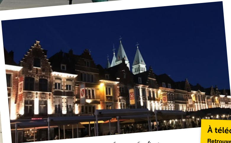
■ La Grand-Place de Tournai et sa cathédrale aux cinq clochers